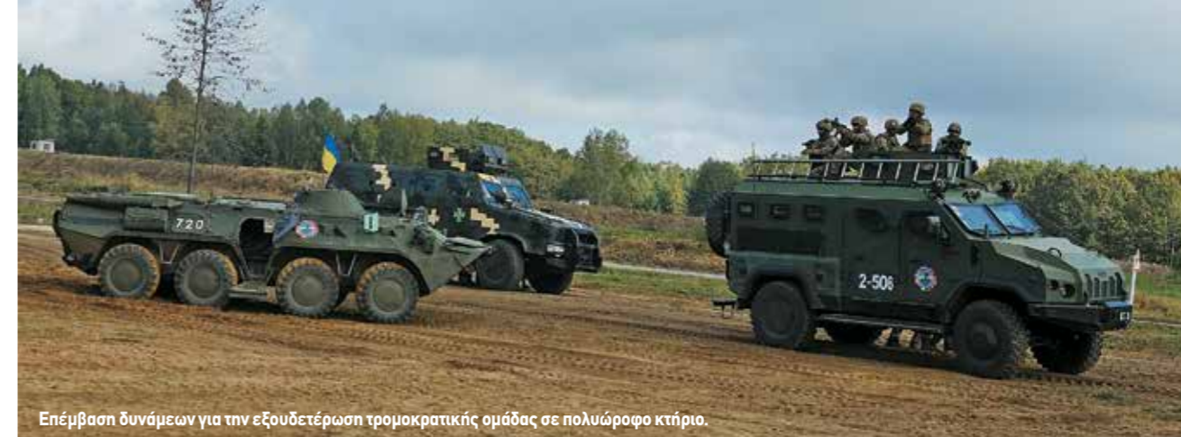
Επέμβαση δυνάμεων για την εξουδετέρωση τρομοκρατικής ομάδας σε πολυώροφο κτήριο.