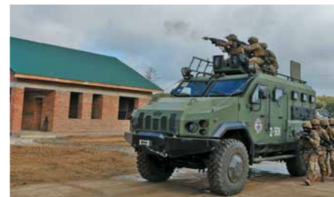
Τεθωρακισμένο όχημα της οικογένειας Varta της Ukranian Armour, βασισμένο σε σασί εμπορικού φορτηγού οχήματος, με κινητήρα 300 ίππων. Προσφέρει προστασία από βολίδες των 7,72 mm, νάρκες και IED.