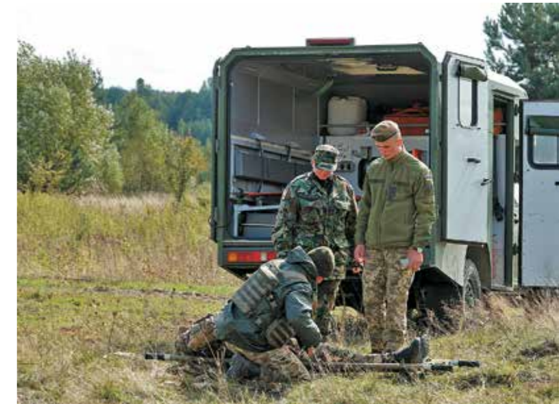
Βούλγαροι εκπαιδευτές από το πολυεθνικό κέντρο IPSC στο Yavoriv