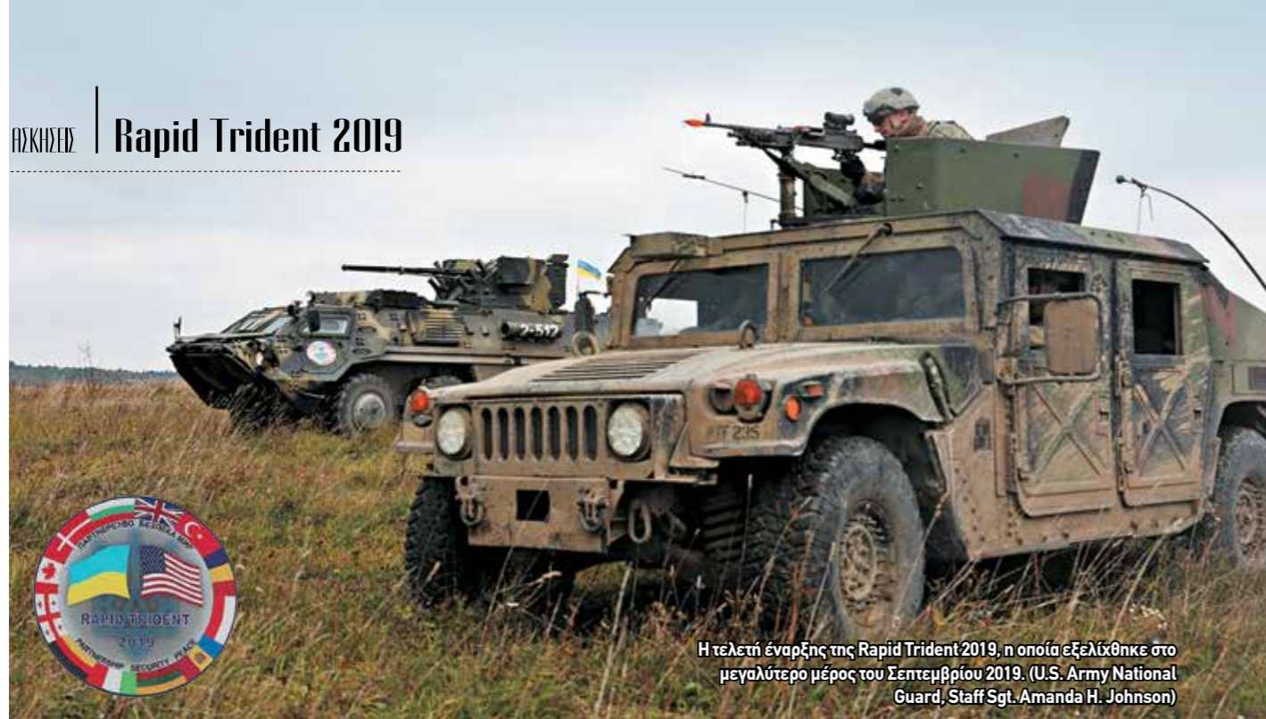
Η τελετή έναρξης της Rapid Trident 2019, η οποία εξελίχθηκε στο μεγαλύτερο μέρος του Σεπτεμβρίου 2019.