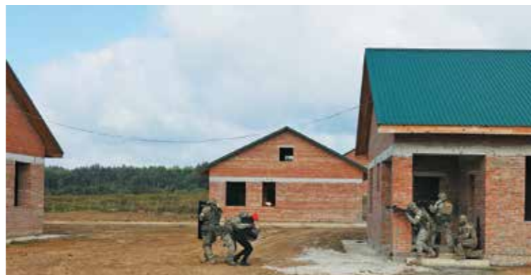
Δράση διάσωσης και απομάκρυνσης ομήρων που κρατούσαν τρομοκράτες σε οικία.