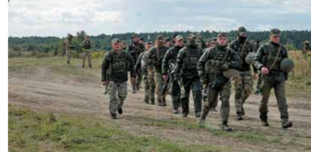
Οι εκπαιδευόμενοι στη Medical STX ήταν έφεδροι της 10ης Ουκρανικής Ορεινής Ταξιαρχίας Κρούσης.

Μια από τις επιδείξεις εκπαίδευσης στο Υ-CTC που παρακολούθησαμε αφορούσε παροχή πρώτων βοηθειών πεδίου μάχης (Medical STX) για την αντιμετώπιση καταστάσεων, όπως έληψη εξειδικευμένου προσωπικού στην πρώτη γραμμή ή τον μεγάλο χρόνο διακομιδής του τραυματία στα μετόπισθεν. Τα αντικείμενα, στα οποία οι εκπαιδευτές ήταν Βούλγαροι, στελέχη του IPSC, και οι εκπαιδευόμενοι έφεδροι της 10 ης Ορεινής Ταξιαρχίας Κρούσης του Ουκρανικού Στρατού, αφορούσαν την περιθαψή τραυματία κάτω από εχθρικά πυρά και περιθαψή εκτός των δραστηκών εχθρικών πυρών.