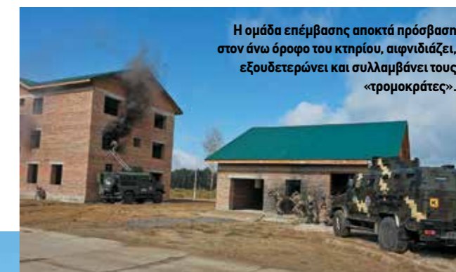
Η ομάδα επέμβασης αποκτά πρόσβαση στον άνω όροφο του κτηρίου, αιφνιδιάζει, εξουδετερώνει και συλλαμβάνει τους «τρομοκράτες».