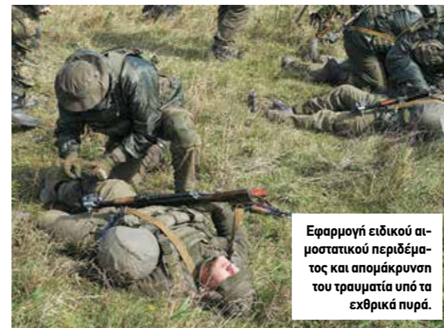
Εφαρμογή ειδικού αιμοστατικού περιδέματος και απομάκρυνση του τραυματία υπό τα εχθρικά πυρά.