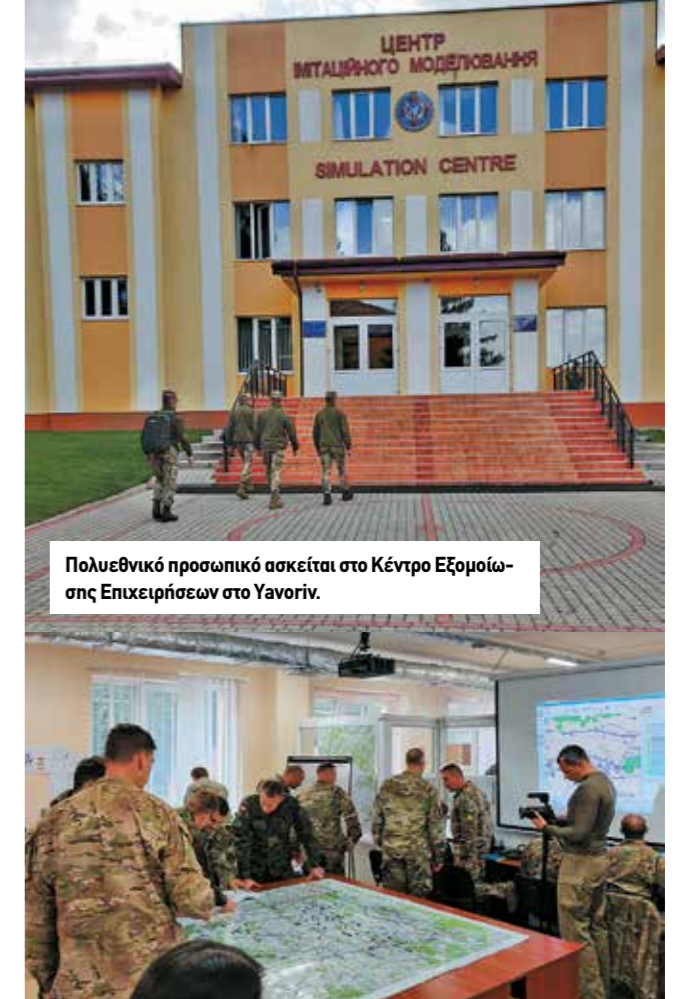
Πολυεθνικό προσωπικό ασκείται στο Κέντρο Εξομοίωσης Επιχειρήσεων στο Yavoriv.

Η κύρια αμερικανική συμμετοχή στην RT19 αφορούσε στην Task Force Carentan (από την ιστορική ομώνυμη μάχη στις επιχειρήσεις