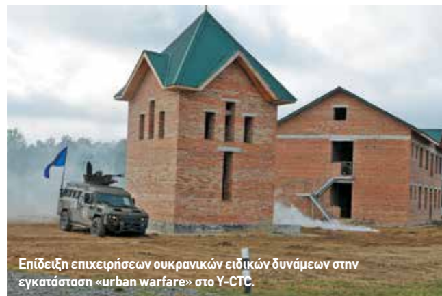
Επίδειξη επιχειρήσεων ουκρανικών ειδικών δυνάμεων στην εγκατάσταση «urban warfare» στο Υ-CTC.

να συνδυαστεί για αντικείμενα όπως περίπολοι μάχης, CSAR, διάσωση ομήρων, προστασία μηχανοκίνητων φαλάγγων κ.ά. Στη διάρκεια της επίσκεψής μας στο CTC έγινε επίδειξη αντιτρομοκρατικής δράσης ουκρανικών ειδικών δυνάμεων και διάσωση αμάχων, ενώ οι «Blue Spaders», στρατιώτες του Λόχου «Delta» του κλιμακίου της 101 ης Αερομεταφερόμενης Μεραρχίας, υλοποίησαν εκκαθάριση κτιρίου.